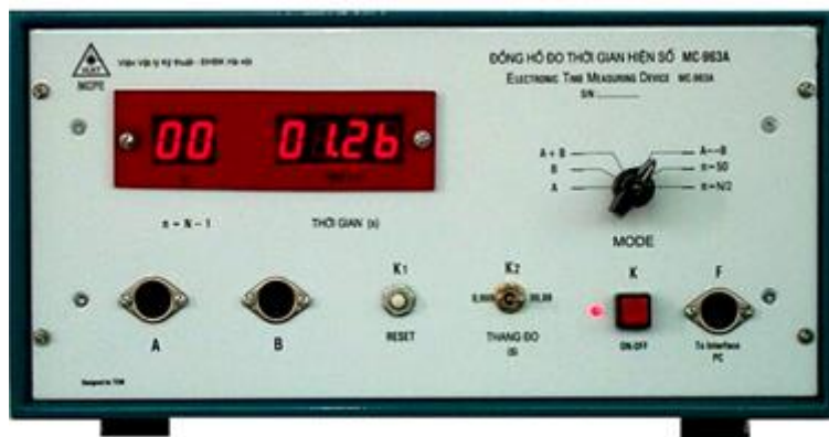
Hình 2. Đồng hồ đo thời gian hiện số

Trên đây là đồng hồ đo của chúng ta (trông rất hiện đại), chú ý một số phòng đồng hồ có thể hơi khác nhưng nhìn chung thì cũng tương tự thế này \rightarrow các bạn chú ý thông số ban đầu của đồng hồ này (thường là đã được thiết lập sẵn nên chỉ cần bấm mỗi khóa K và kết nối là xong, tuy nhiên có một số trường hợp những nhóm làm trước chơi tuyệt chiêu qua